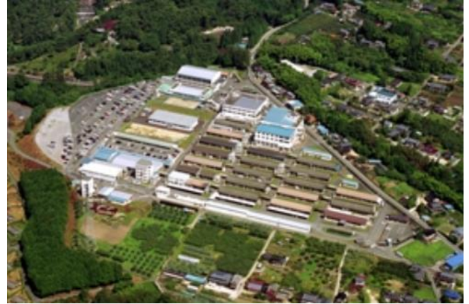
多摩川精機（株）本社・第一事業所